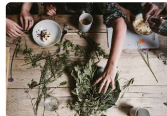
Ethnobotaniste, plantes sauvages comestibles

Au gré d'une magnifique balade en forêt, apprenez à reconnaître les plantes sauvages comestibles , leur sens, leur utilité, leur goût... afin de se reconnecter à la nature en toute saison. Puis préparez un apéritif ou un déjeuner avec le résultat de votre cueillette . Un moment rare à partager avec vos collaborateurs amoureux de la bonne cuisine.