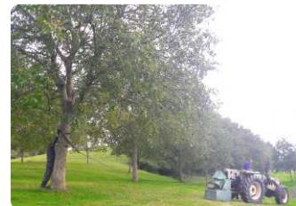
Jean-Pierre, producteur de noix, St-Michel-de-St-Geoirs 38590

Découvrez activement les champs de noyers de Mon Cœur en Isère, en partageant une tradition annuelle et familiale qui dure depuis plus de 50 ans : ramassage des noix aux rouleaux, lavage, tri, séchage. L'une des seules exploitations à pratiquer encore le ramassage à la main . Le déjeuner se veut typique à base de noix et de produits locaux. Le ramassage s'effectue entre le 15 et 20 octobre.