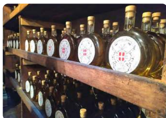
Liquoriste, Vigneron, Potier, Vannier, Artisans locaux...